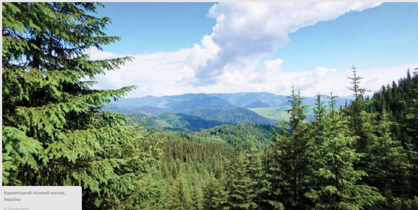
Карпатський лісовий масив, Україна