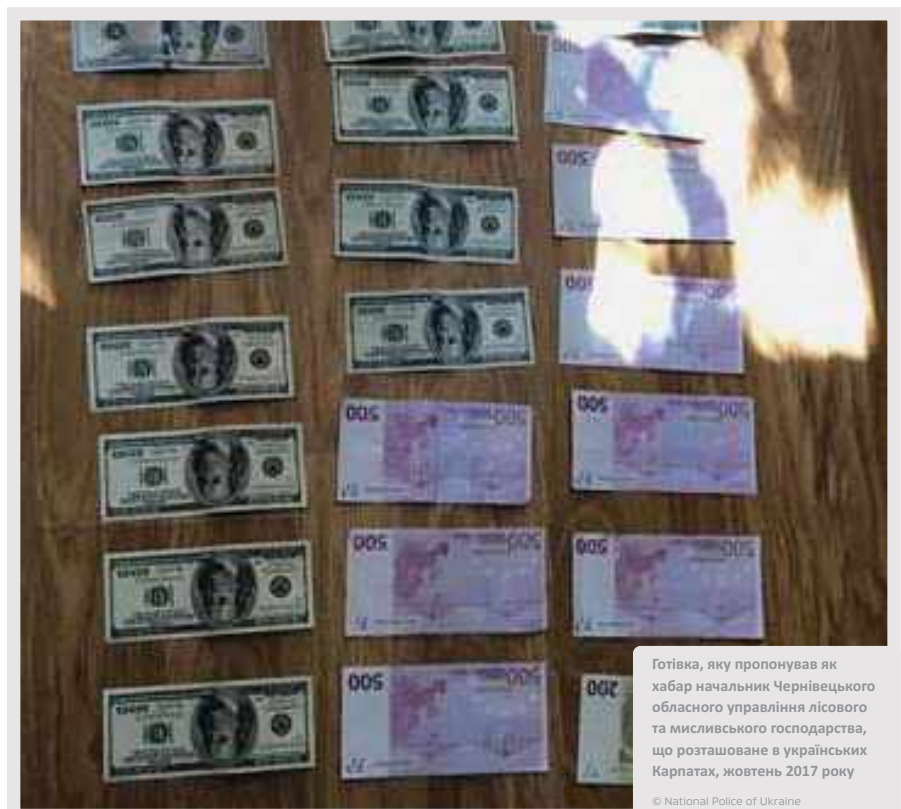
Готівка, яку пропонував як хабар начальник Чернівецького обласного управління лісового та мисливського господарства, що розташоване в українських Карпатах, жовтень 2017 року

Один із начальників обласного управління лісового та мисливського господарства у Карпатах був затриманий у жовтні 2017 року після того, як запропонував щомісячну «зарплату» у 10 тис. доларів керівникам правоохоронних органів за те, щоб вони закрили очі на незаконну вирубку лісу.